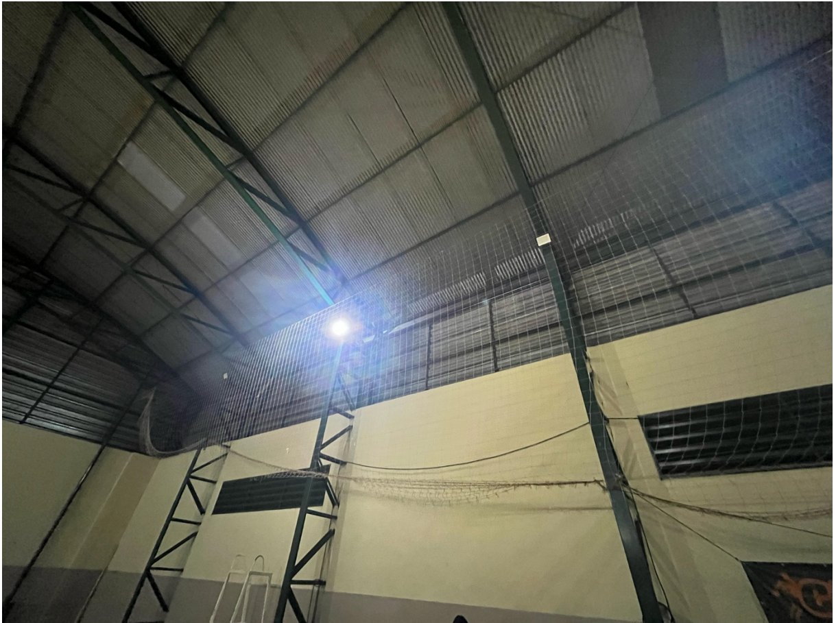
Ginásio Poliesportivo Osvaldo Angeloni, Jardim Centenário

PROTOCOLO 51174/2025 - 02/04/2025 12:28 - PROCESSO 562/2025