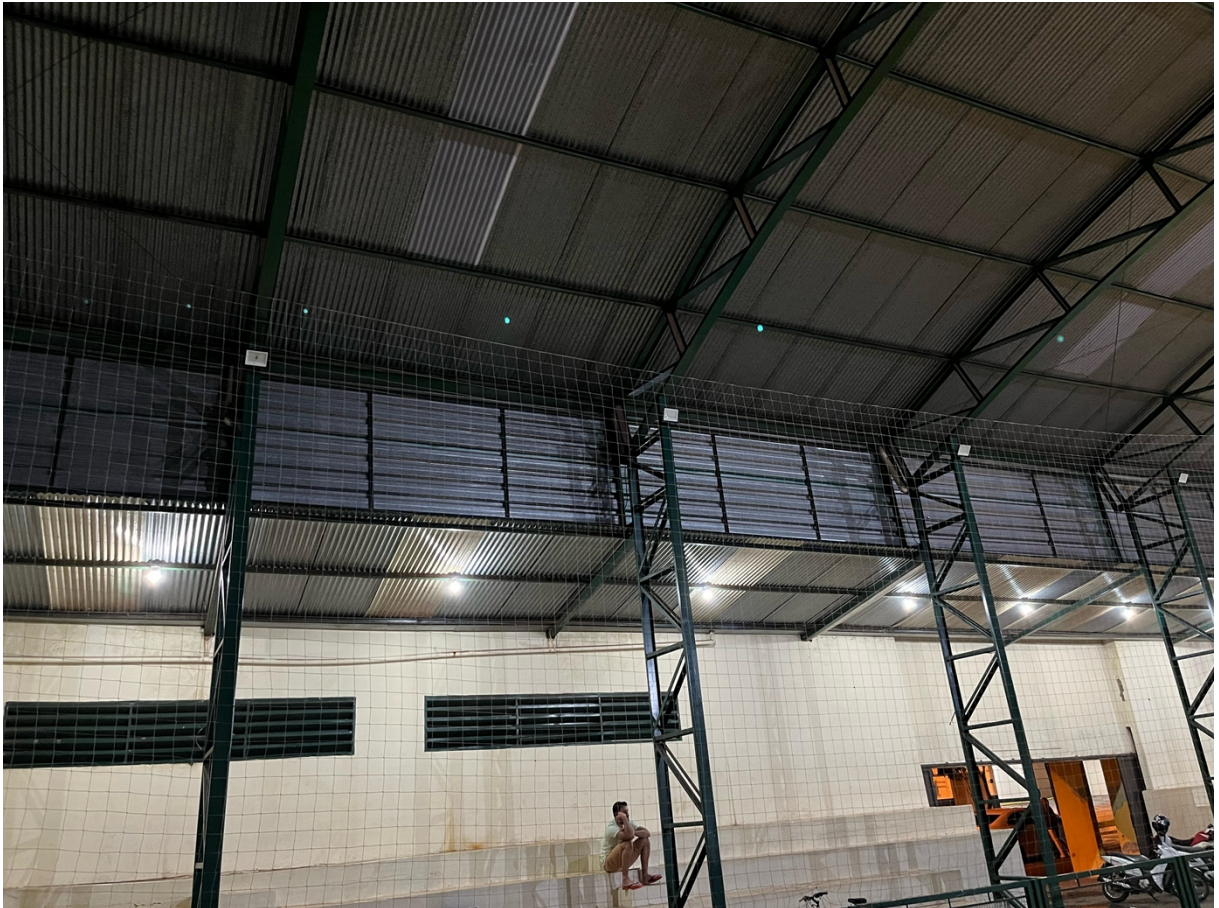
Ginásio Poliesportivo Osvaldo Angeloni, Jardim Centenário

DOCUMENTO ASSINADO DIGITALMENTE - PROTOCOLO:51174/2025 - 02/04/2025 - 12:28 - 9643-DM11-NSR3-K2AO