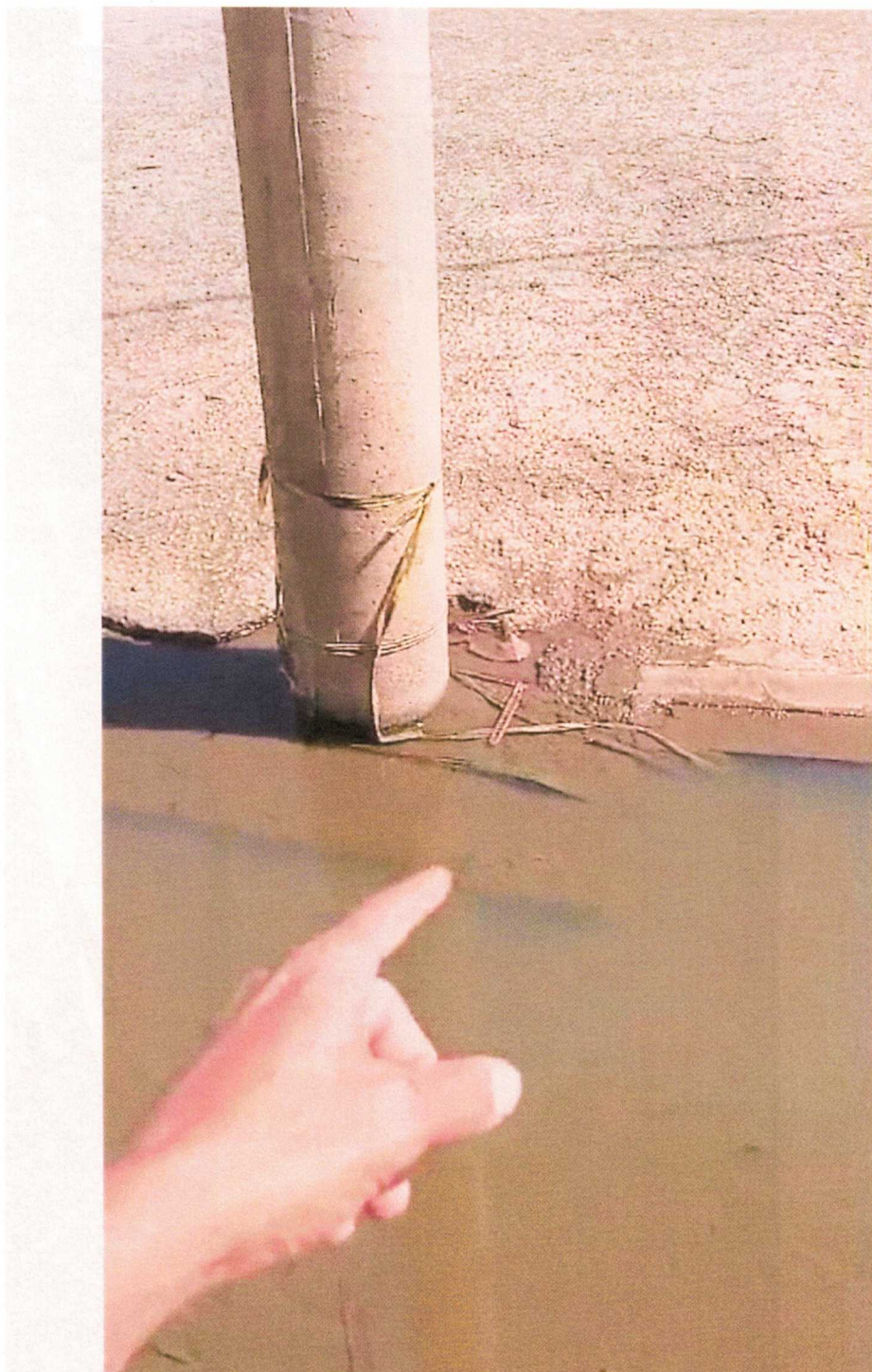
Fita zebraada colocada pela Garagem para sinalizar o perigo do bueiro