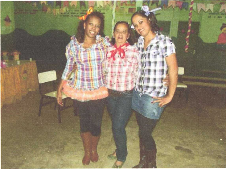
Semeando Futuro 2012-2014