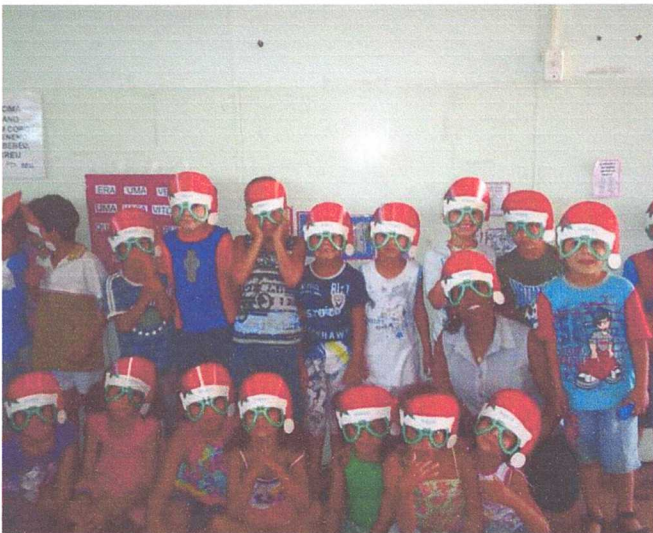
1ª turma 2011

Acredito totalmente na pedagogia do amor onde a relação o professor e a criança é um momento de crescimento e troca, laços, afetos e cuidado é com o amor que podemos passar por experiências incríveis. “Não se pode falar de educação sem amor” parafraseando Paulo Freire.