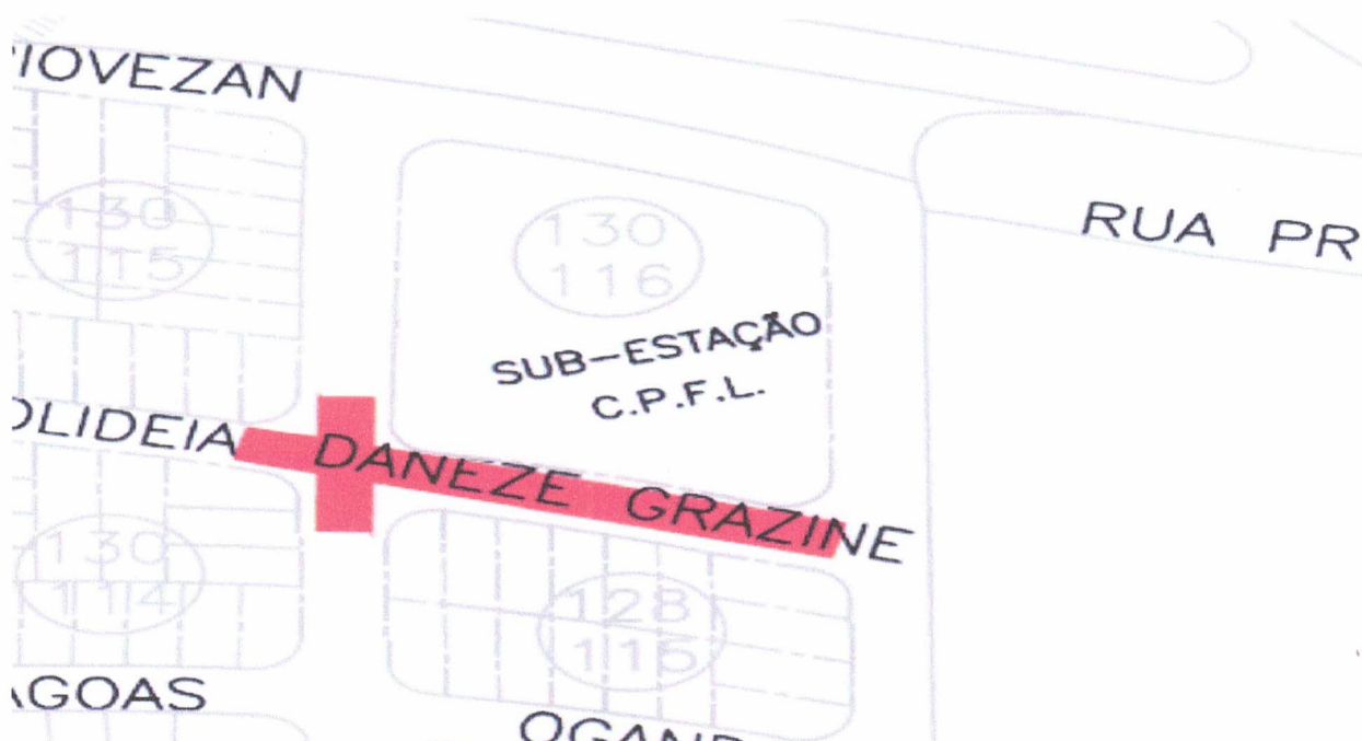
Rua Solideia Daneze Grazi

Mapa das ruas do a serem recuperadas neste projeto: