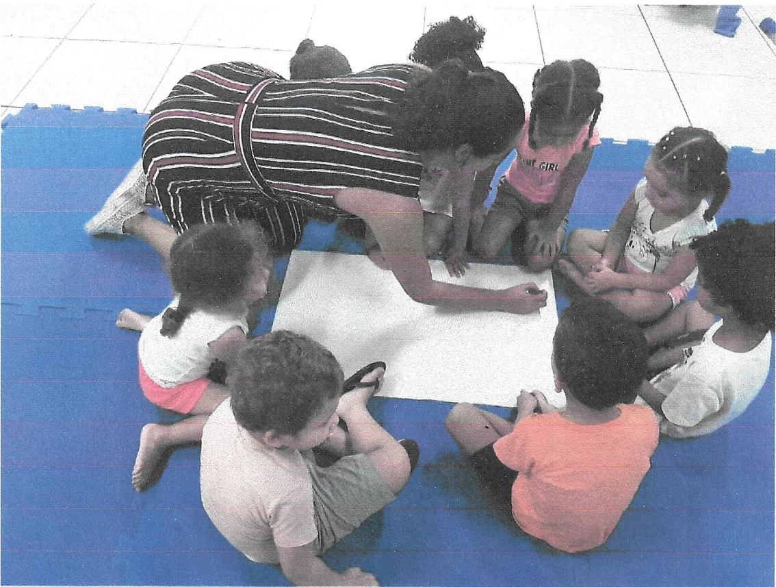
Proposta desenvolvida em pequenos grupos professor como escriba