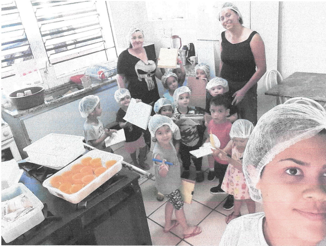
Entrevista com a cozinheira