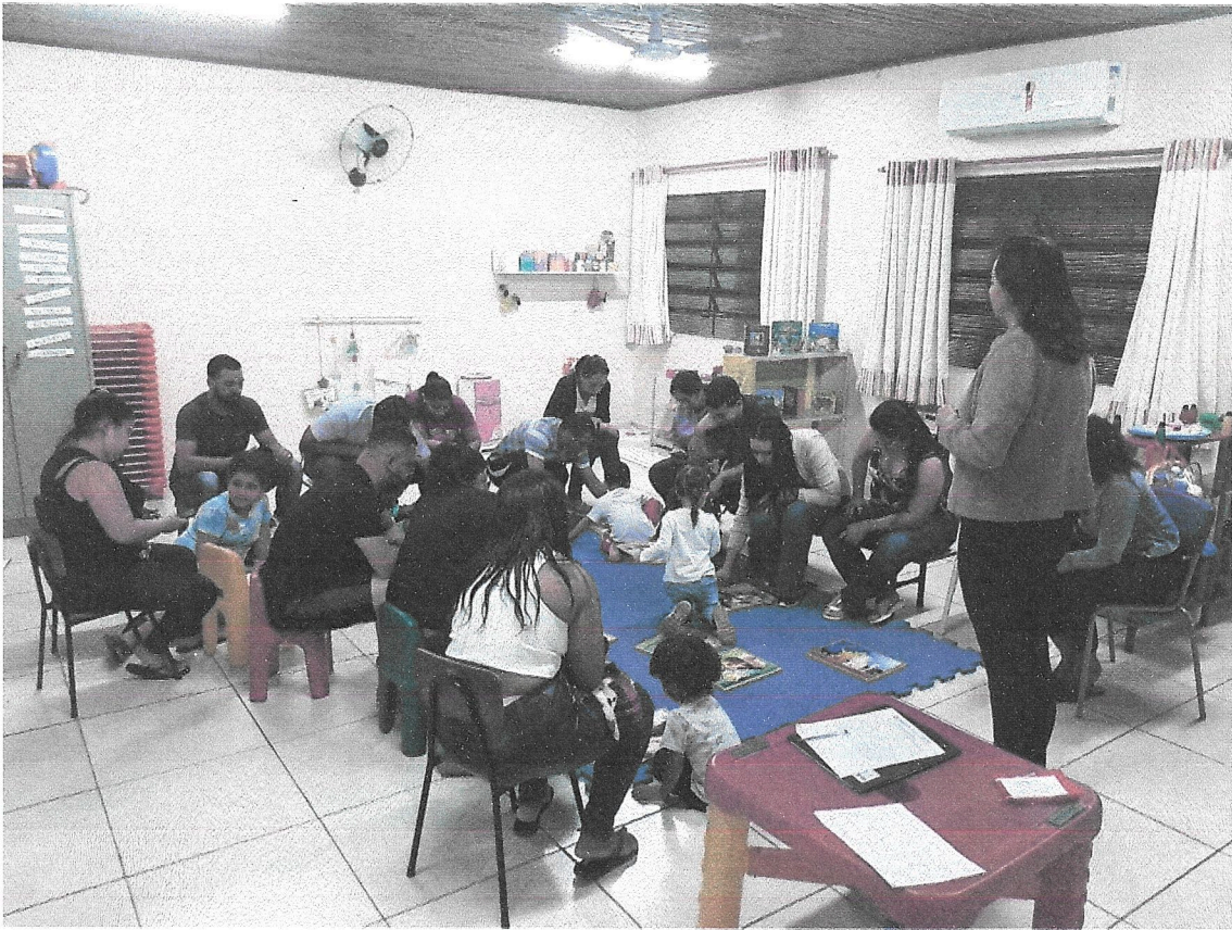
Interação com as famílias na reunião de pais