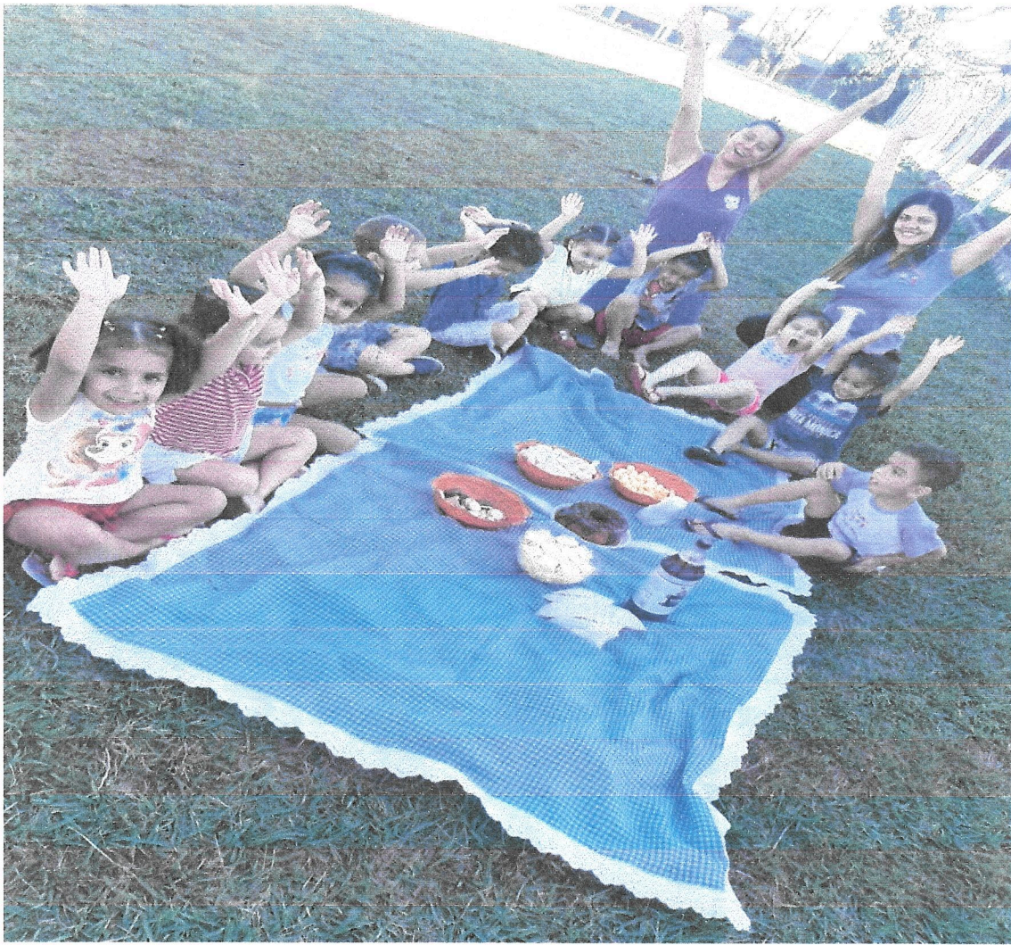
Piquenique com a turminha encerrando o 1º semestre.