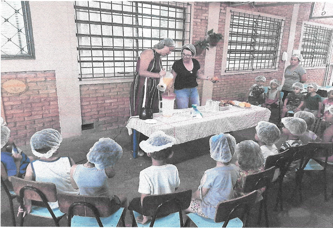
Proposta de culinária em interação com as turmas dos maternais