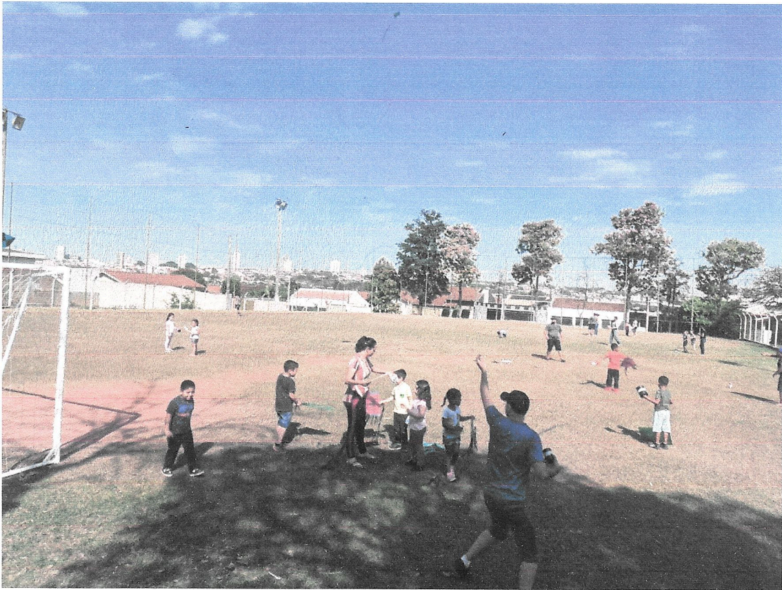
Interação com as famílias no campo