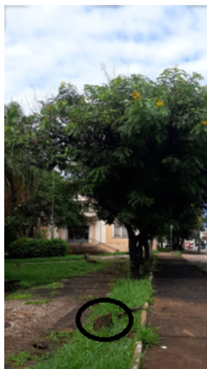
CORTE APÓS MORTE DA ÁRVORE