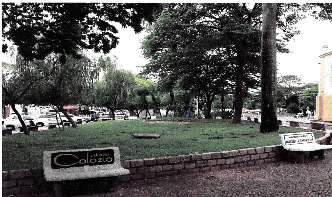
Situação anterior a realização da obra, canteiros sem iluminação