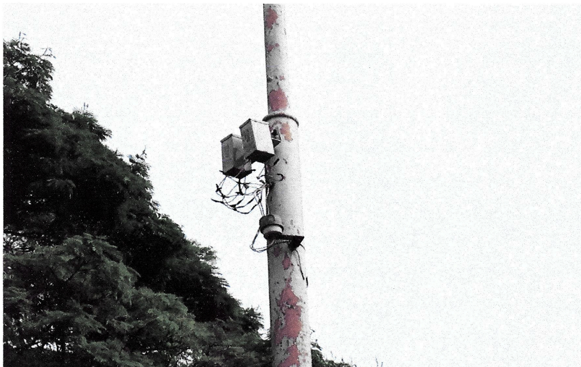
Postes obsoletos que estavam locados ao lado dos sanitários da Concha Acústica