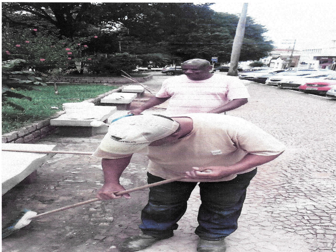
Manutenção de pedras portuguesa, realizada nas praças citadas.

Sem mais, encontramos-nos a disposição para dirimir quaisquer dúvidas e/ou esclarecimentos.