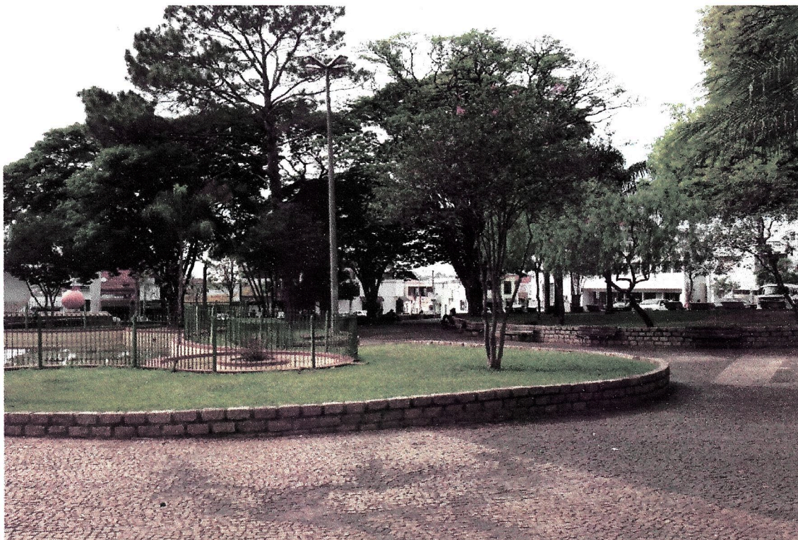
Apenas duas luminárias centrais na Praça Barão do Rio Branco, locadas ao lado da Fonte Sonoro Luminosa.