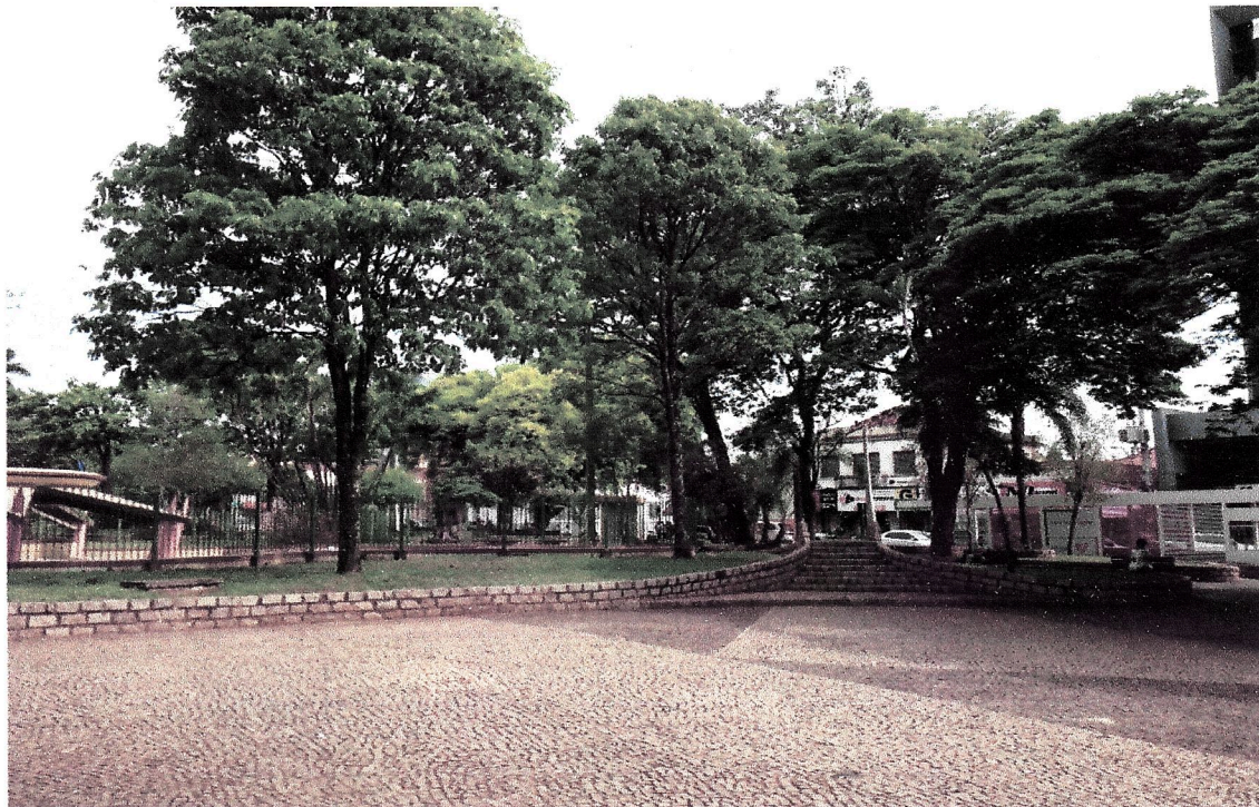
Situação anterior a realização da obra, canteiros sem iluminação