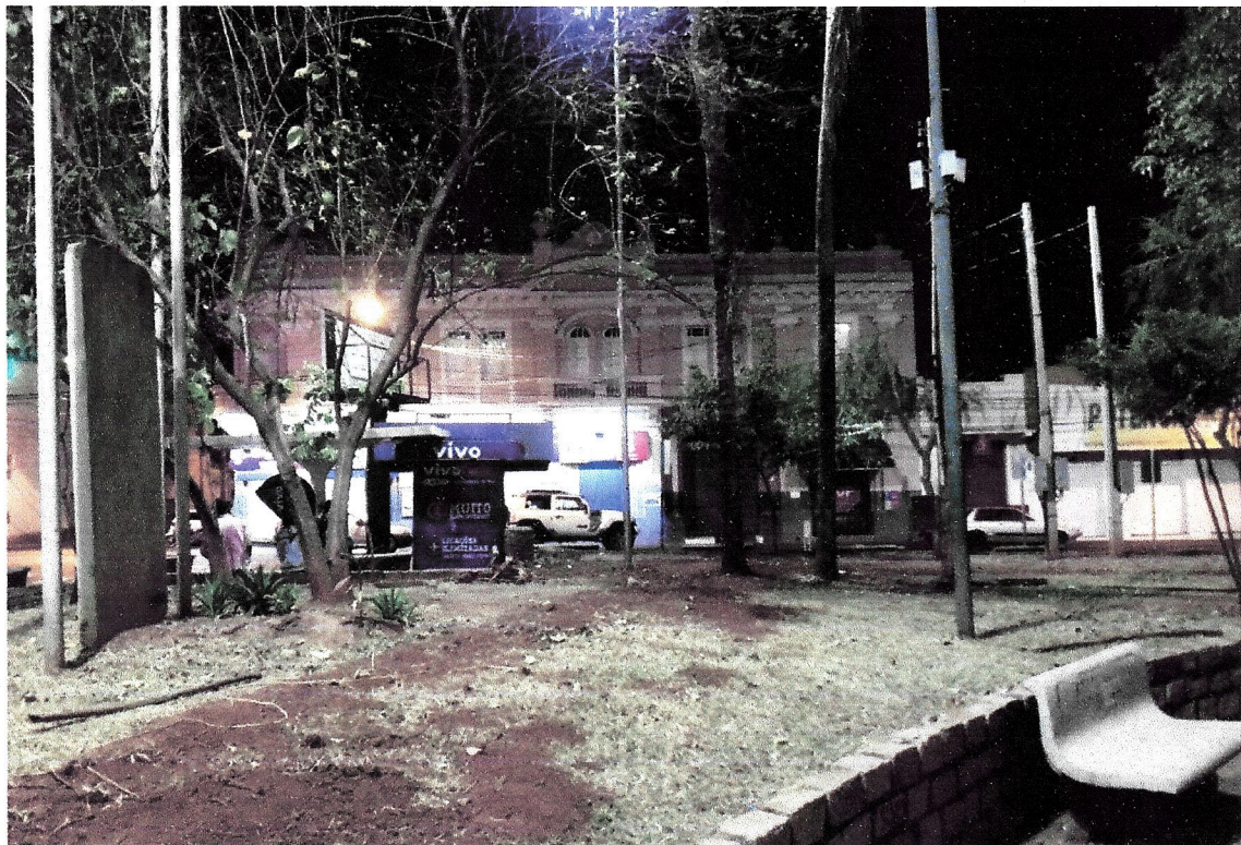
Resultado final após a conclusão da obra, praças com excelente nível de iluminação