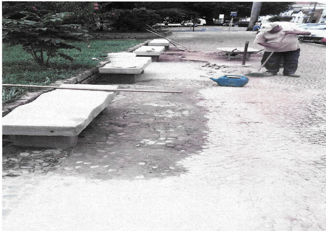
Manutenção de pedras portuguesa, realizada nas praças