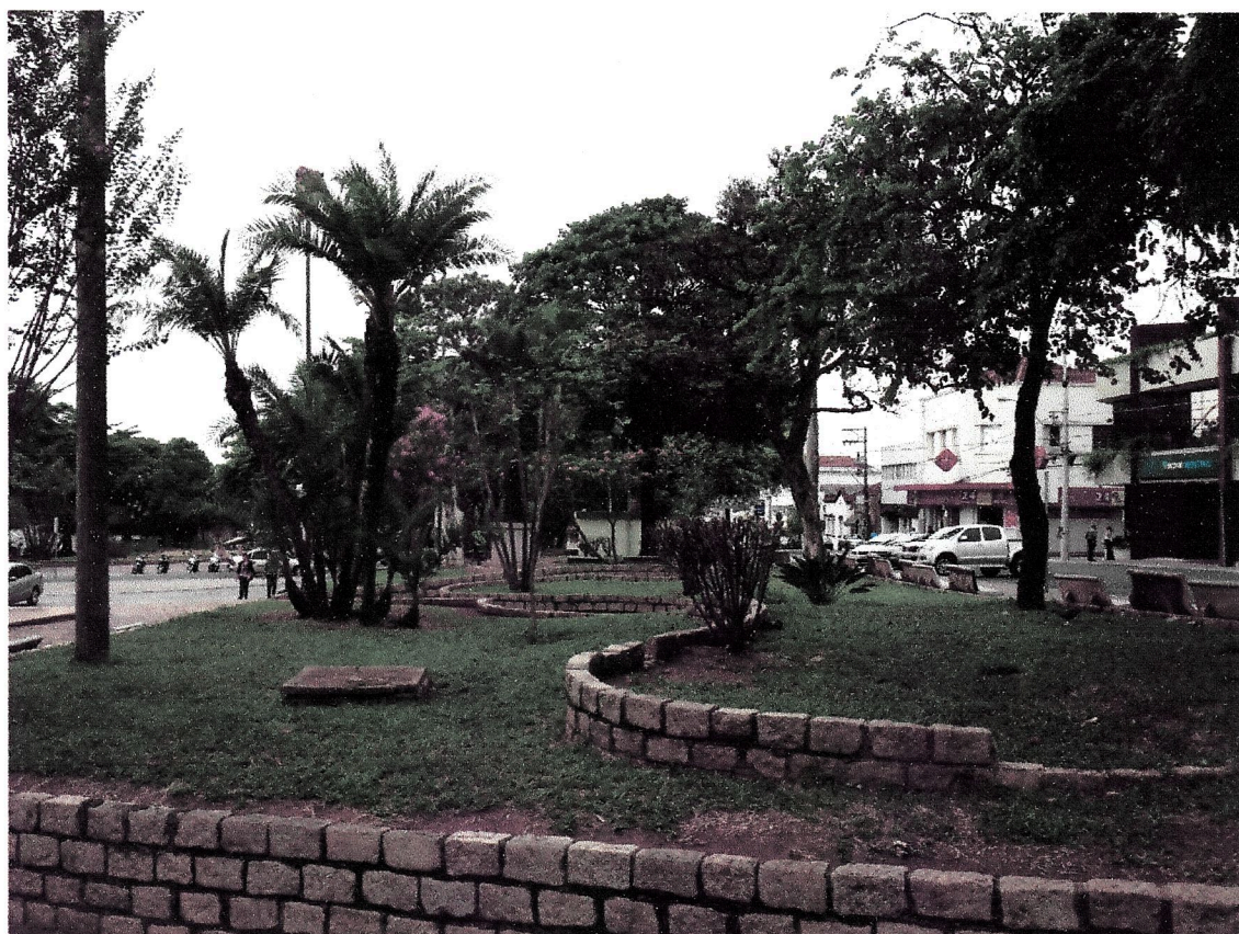
Situação anterior a realização da obra, canteiros sem iluminação