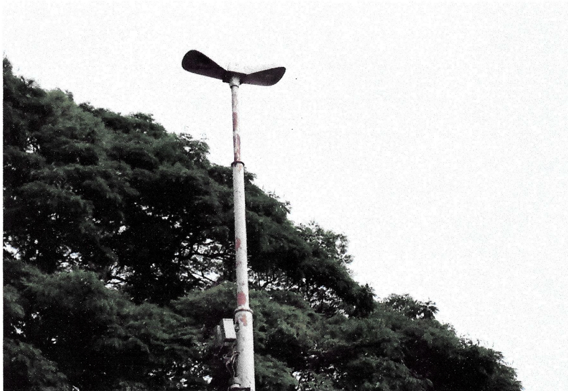
Postes obsoletos que estavam locados ao lado dos sanitários da Concha Acústica