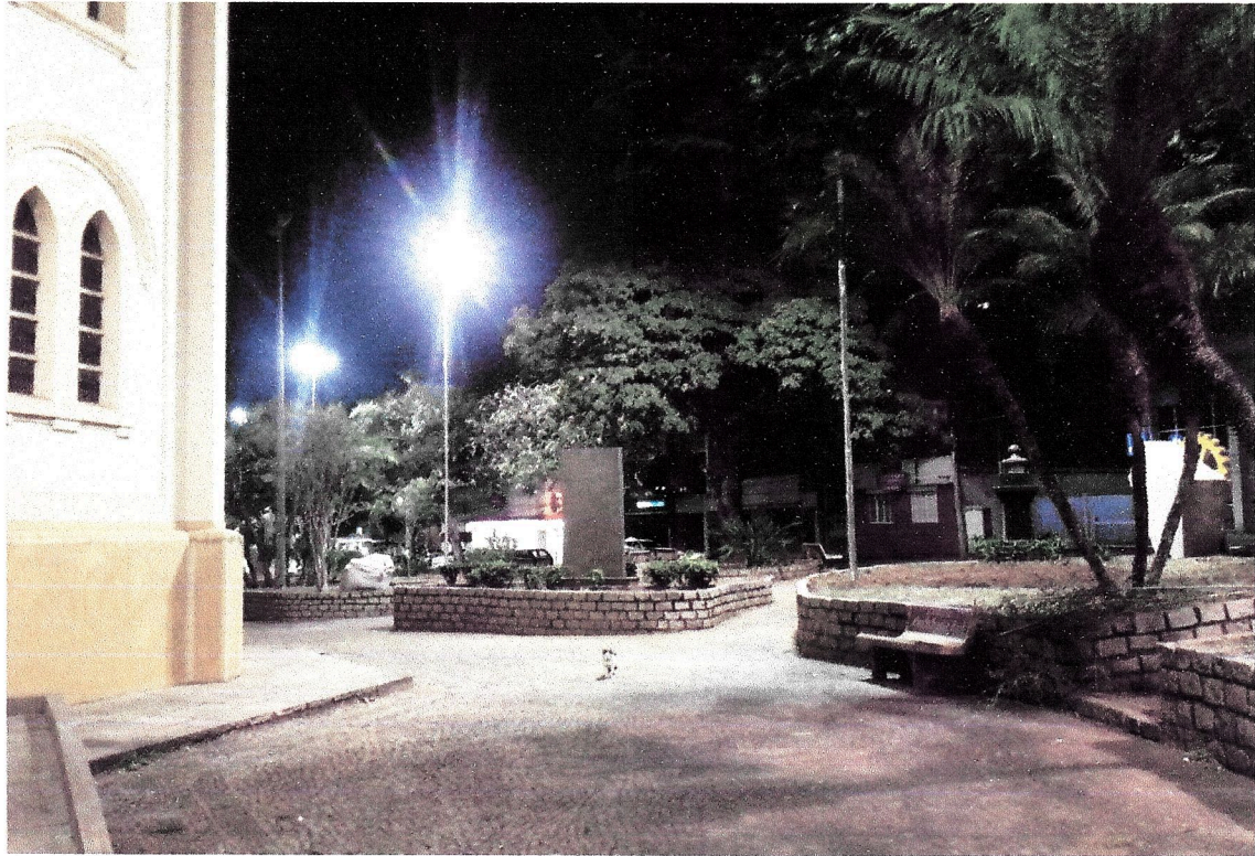
Resultado final após a conclusão da obra, praças com excelente nível de iluminação