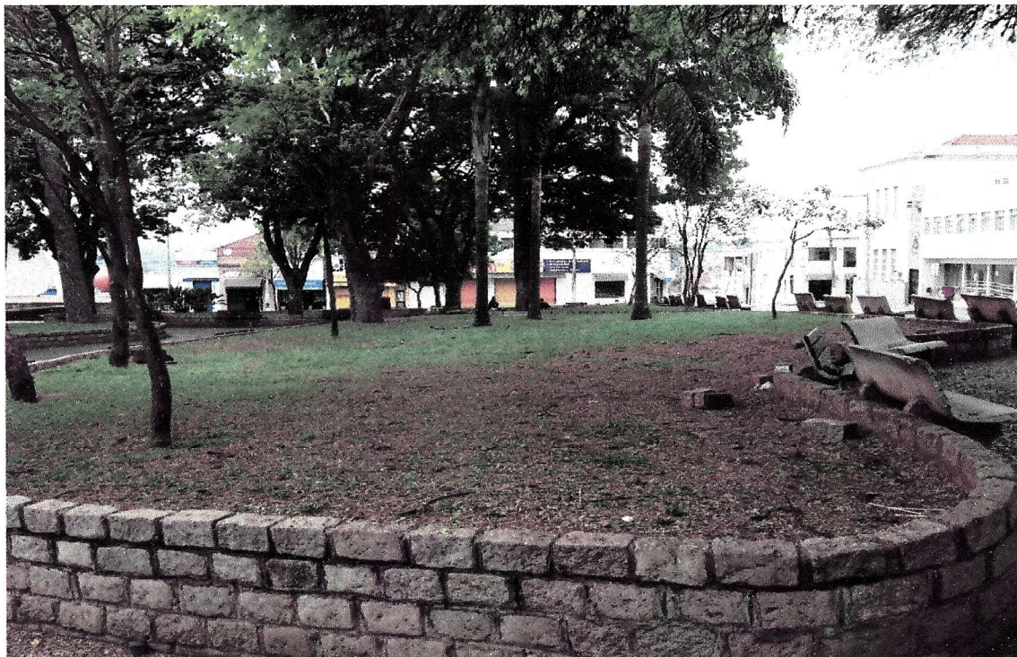
Situação anterior a realização da obra, canteiros sem iluminação