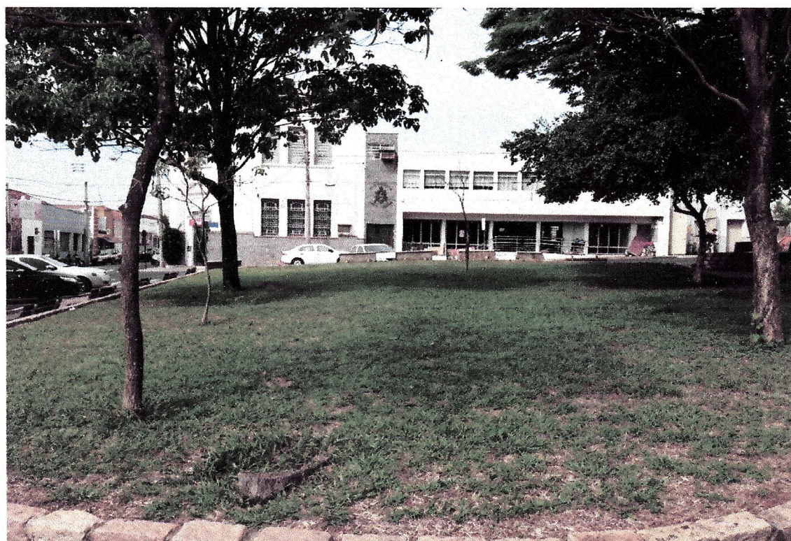
Situação anterior a realização da obra, canteiros sem iluminação