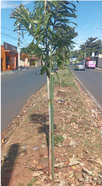
Tutoramento de mudas