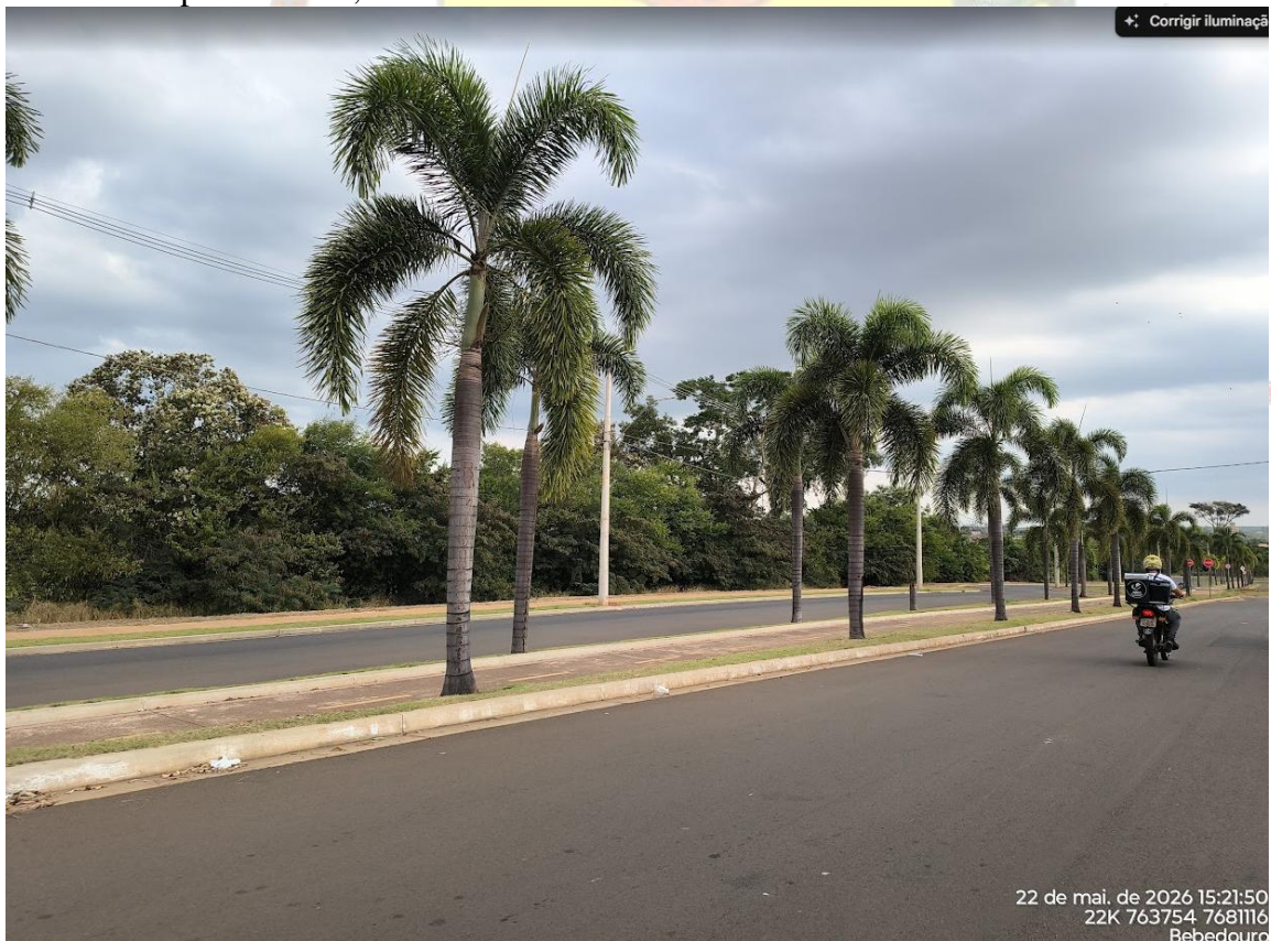
Avenida em Bebedouro, com palmeiras já adultas.

Secretaria Municipal do Clima, Meio Ambiente e Sustentabilidade Praça José Stamato Sobrinho, 45 – Centro – Bebedouro – SP Fones: (17)3345-9108 / (17)3345-9106