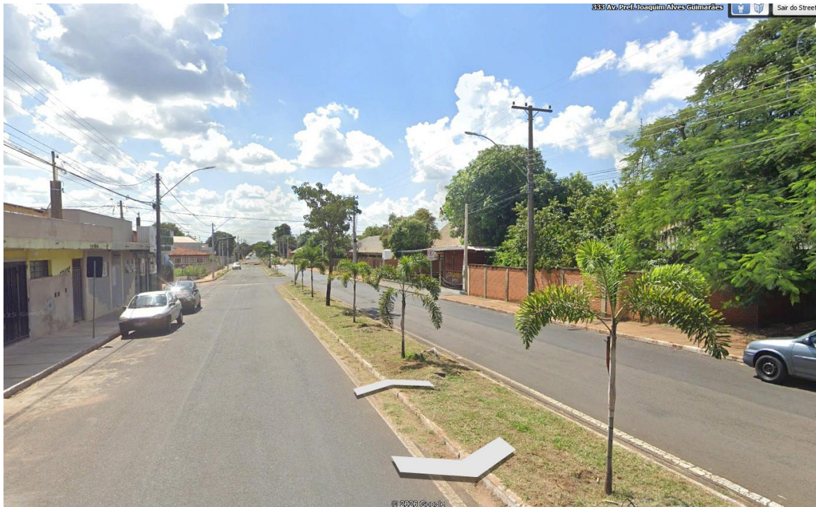
Área inicial plantada – 1,5 ano