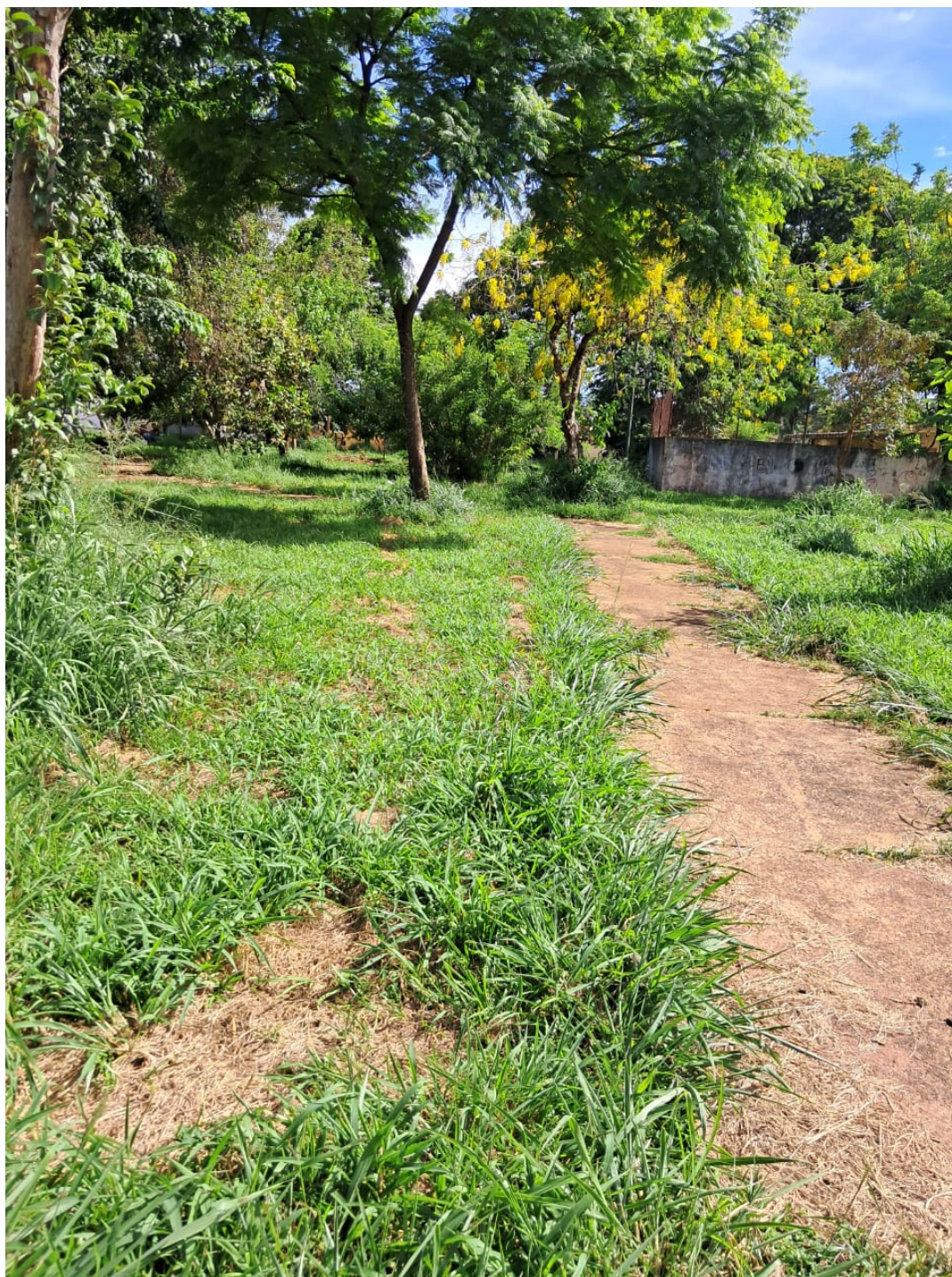
Praça Domingos Ribeiro - Alameda Pedro Liberato, Jardim Cláudia II

PROTOCOLO 53863/2026 - 19/01/2026 10:13 - PROCESSO 93/2026