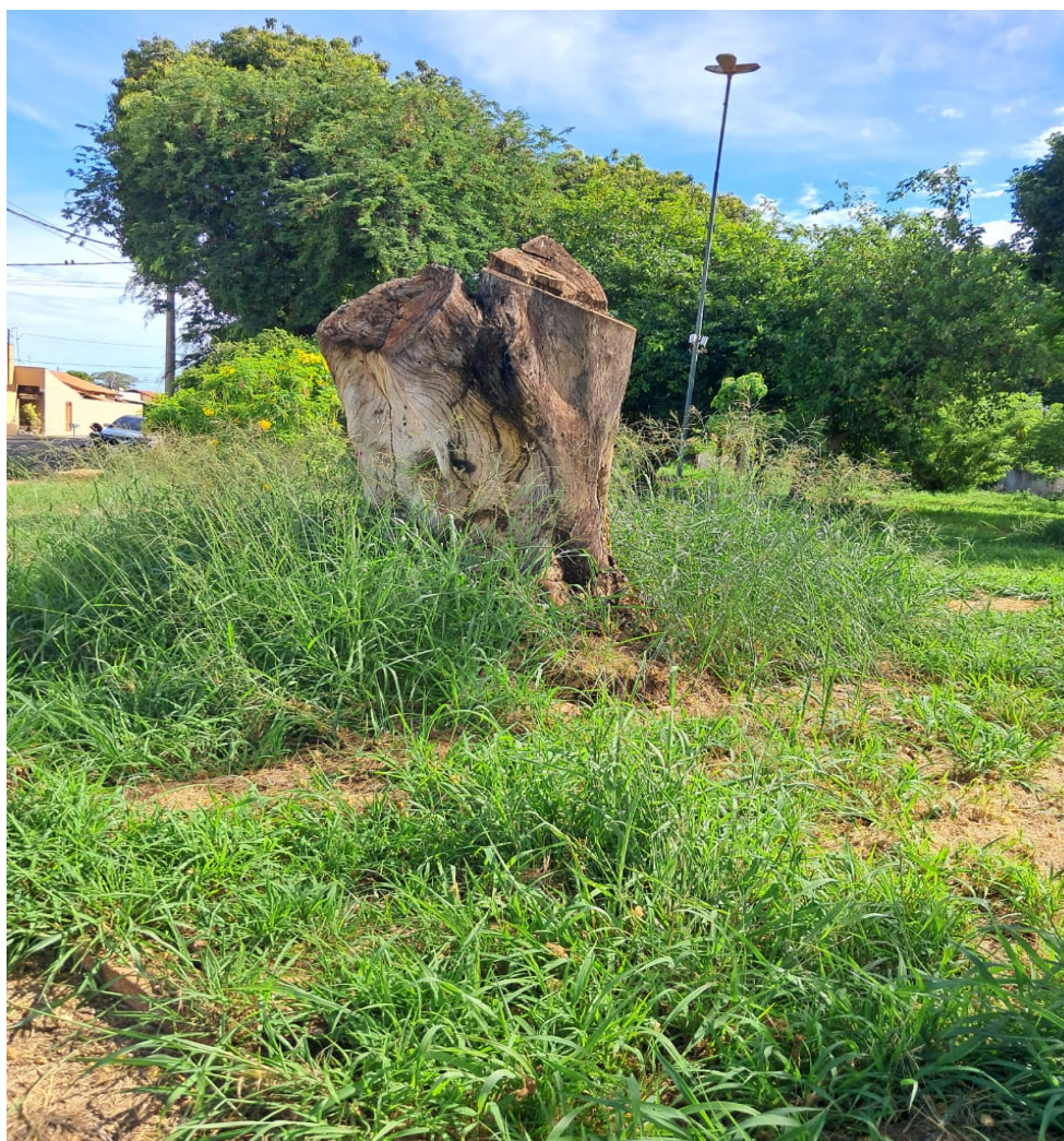
Praça Domingos Ribeiro - Alameda Pedro Liberato, Jardim Cláudia II

ESTADO DE SÃO PAULO www.camarabebedouro.sp.gov.br