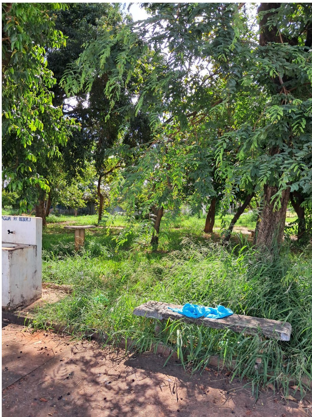
Praça Domingos Ribeiro - Alameda Pedro Liberato, Jardim Cláudia II