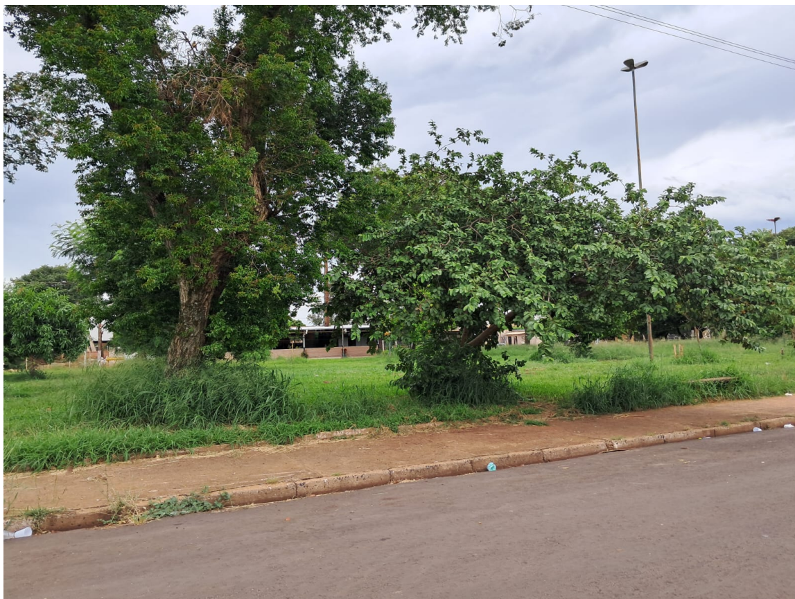
Praça Domingos Ribeiro - Alameda Pedro Liberato, Jardim Cláudia II

PROTOCOLO 53863/2026 - 19/01/2026 10:13 - PROCESSO 93/2026