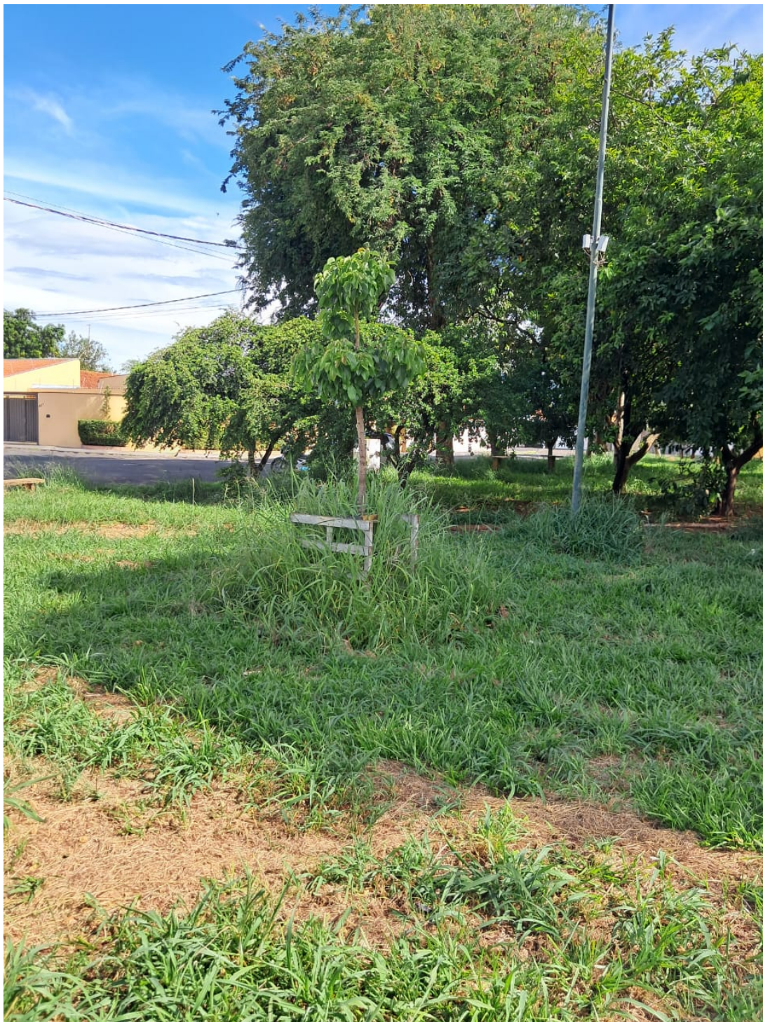
Praça Domingos Ribeiro - Alameda Pedro Liberato, Jardim Cláudia II

PROTOCOLO 53863/2026 - 19/01/2026 10:13 - PROCESSO 93/2026