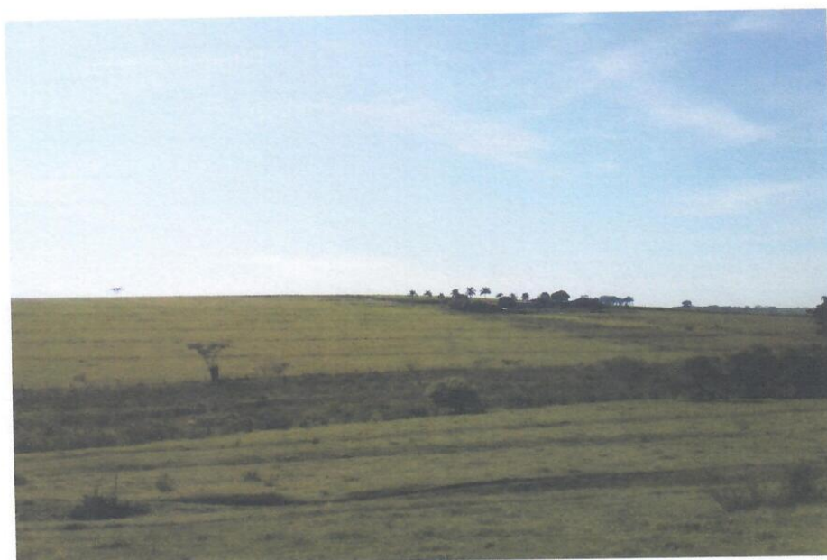
Foto 01 – Detalhe – Vista da Estrada Municipal BBD – 472 do Município de Bebedouro/SP.

Foto 02 – Detalhe – Vista da Estrada Municipal BBD - 472 do Município de Bebedouro/SP.