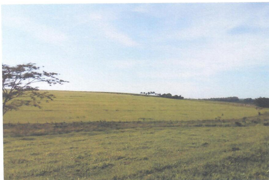
Foto 03 – Detalhe – Vista da Estrada Municipal BBD – 472 do Município de Bebedouro/SP.