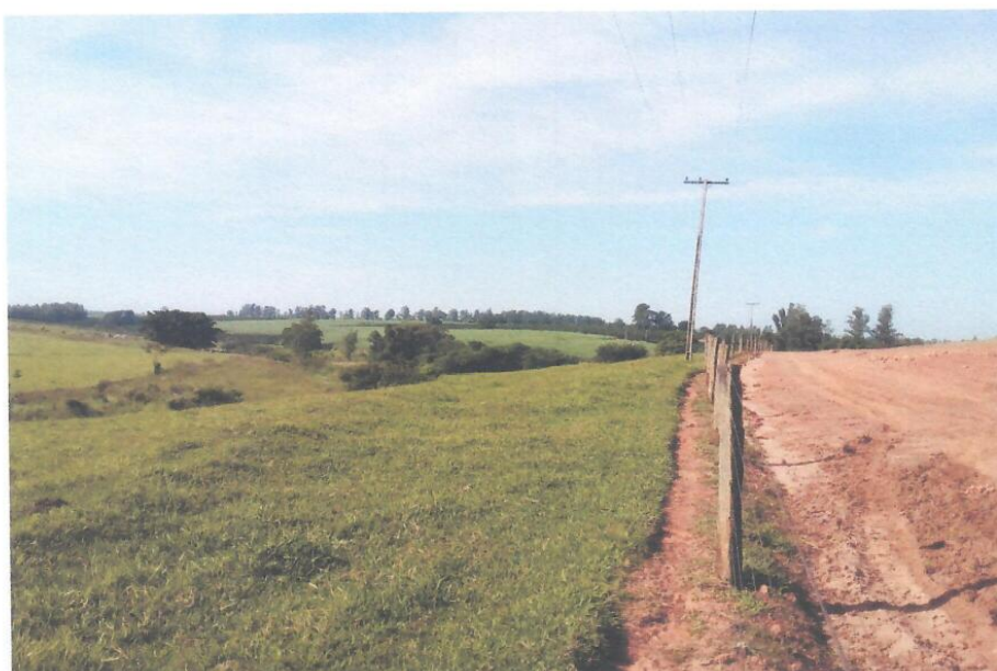
Foto 05 – Detalhe – Vista da Estrada Municipal BBD – 472 do Município de Bebedouro/SP.