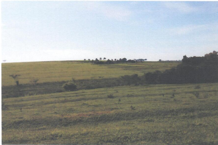
Foto 07 – Detalhe – Vista da Estrada Municipal BBD - 472 do Município de Bebedouro/SP.

Foto 08 – Detalhe – Vista da Estrada Municipal BBD - 472 do Município de Bebedouro/SP.