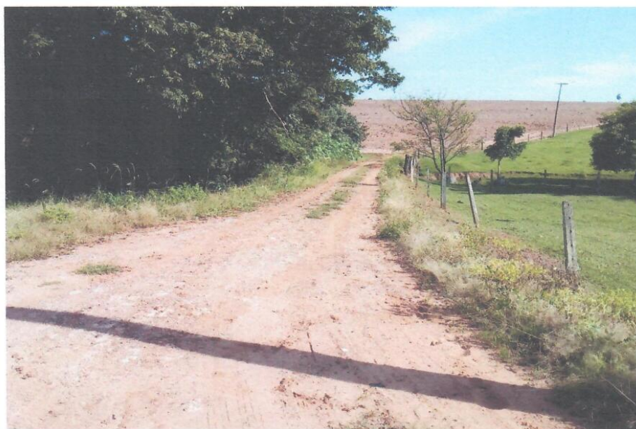
Foto 09 – Detalhe – Vista da Estrada Municipal BBD – 472 do Município de Bebedouro/SP.