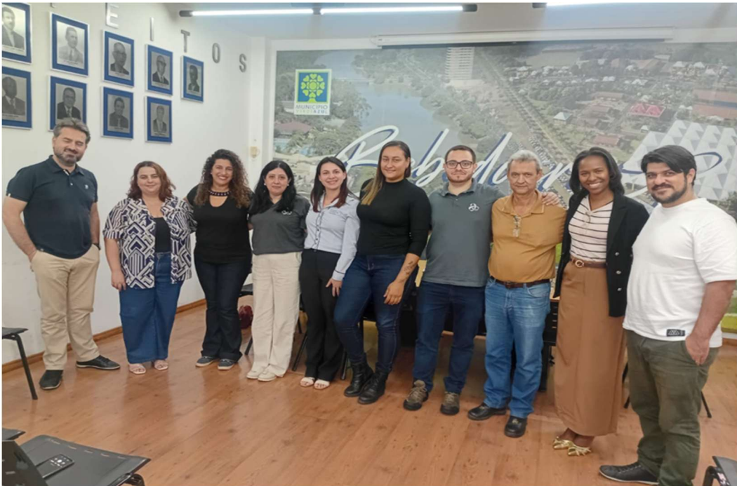
Green Franquias e Secretarias na Prefeitura de Bebedouro (24/04/25)

Segue kit básico de equipamentos de operação para início das atividades em Bebedouro